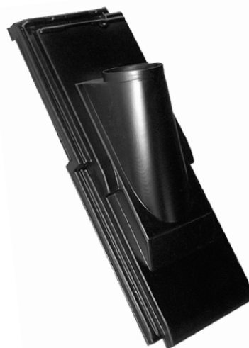
2-pans doorvoerpan met vaste opstand