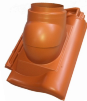
doorvoerpan met schaaldeel

De doorvoerpannen met schaaldeel worden geleverd voor het doorvoeren van ronde pijpen. Voor een dakhelling tussen de 15 en 40° en een diameter van max. Ø131 mm kan meestal de dakdoorvoer met schaaldeel worden toegepast.