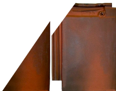
langs hoek en kilkepers

Bij het dekken van de dakpannen komen vaak situaties voor waarbij de ophangnokken van de pannen afgezaagd moeten worden. Hierbij kunt u denken aan aansluitingen met dakvensters, dakkapellen en gevels. Ook langs de hoekkepers blijven vaak kleine stukjes dakpan over, die men apart moet bevestigen. Door de pannen vooraf te verlijmen kunnen deze strak worden gezaagd en zonder verdere hulpmiddelen op de panlatten worden aangebracht.